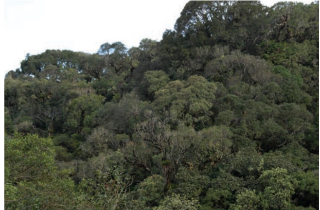
Figura 1. Mata Atlântica do alto da Serra do Mar no Núcleo Santa Virgínia do Parque Estadual da Serra do Mar, no estado de São Paulo, Brasil.

Figure 1. Atlantic Forest on the top of Serra do Mar, at Núcleo Santa Virgínia, Parque Estadual da Serra do Mar, State of São Paulo, Brazil.